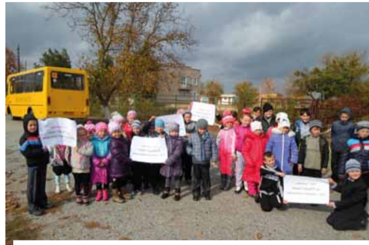
Куйбишевський навчально-виховний комплекс с. Куйбишеве Снігурівського району, Миколаївської обл