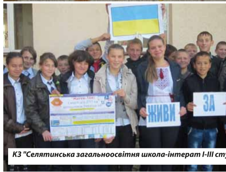
КЗ "Селятинська загальноосвітня школа-інтернат I-III ступенів" с.Селятин, Путильського району, Чернівецької обл