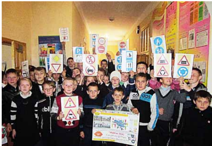
КЗ "Селятинська загальноосвітня школа-інтернат І-ІІІ ступенів" с.Селятин, Путильського району, Чернівецької області

Учасники акції «Життю – ТАК! Смерті дітей від ДТП на автошляхах України – НІ!» 17.11.2014