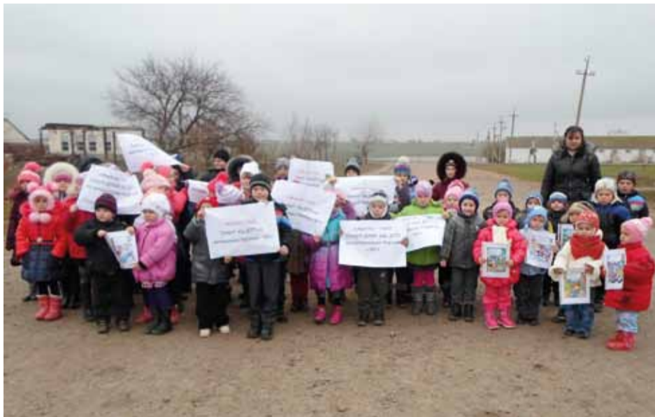
Куйбишевський НВК та Куйбишевський ДНЗ села Куйбишеве Снігурівського району Миколаївської області