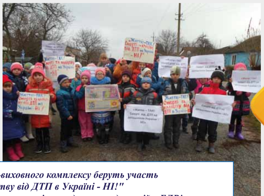
Учні початкових класів Калинівського навчально-виховного комплексу беруть участь у акції "Життю - ТАК! Смерті та каліцтву від ДТП в Україні - НІ!" Дякуємо Вам за активну участь! Запрошуємо всіх наших читачів приєднатись до акцій з БДР!